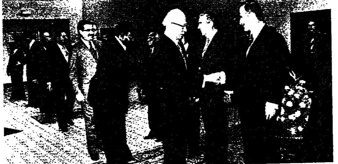
الرئيسان يجيئان للسواء الشهائي والعقيد الحدي

الرؤية المقاتمة لبنانياً وسوريا وفي هذا الاطار هناك رؤية شبيهة موحدة بين لبنان وسوريا ، والتي برزت في لقاء الرئيسين سركيس والاسد . اولاً وبالنسبة للجنوب ، هناك واقع على كافة الاطراف ان تفهمه وتحاول كسر التعاون بين البلدين الشقيقين اكثر من مرة مشيراً الى ان هناك دولتان وكل منهما سيانته واستقلاله، وان التعاون والتنسيق امر مفروض على مستوى دولي ومستوى «الجزيرة» ما يفرضه من مزيد من هذا التعاون . ويرى الرئيس الاسد في هذا المجال ان استمرار دعم اليهود القليلة لضبط القضية اللبنانية بصورة خاصة قضية الجنوب ضمن منطقة محدودة ، هو افضل لحل مثل هذه القضايا ، خاصة وان الدول العربية نفسها غير ملتزمة على أي موقف موحد وان طرح أية قضية تتعلق بالزيرة اللبنانية او بالحدود الجنوبية ان تكون المنطلق كما ينصورها البعض .